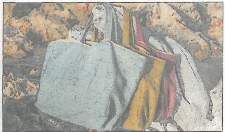
Les sacs cabas de la collection « Cabanon ».

Créée en 1977 et basée à Menton, l'Esatitudo Riviera est une association loi 1901 qui regroupe 127 ouvriers. Son activité est concentrée autour des espaces verts, la restauration, le conditionnement, la broderie, la confiserie et l'entretien.