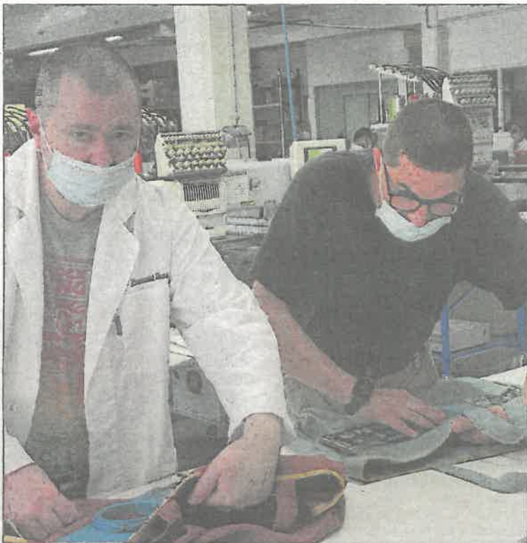
Atelier broderie, à l'Esat de Menton.