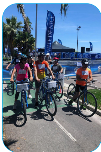
Les triathlètes du Foyer de la Madeleine