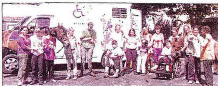
Concept unique en France, la « handi mobile équitation » donne accès à un moment privilégié d'oubli du handicap.

Lorsque imagination et générosité se mobilisent, on peut réussir des exploits. La preuve en est apportée par la maison d'accueil spécialisée des Fontaines avec les journées consacrées à l'activité « handi mobile équitation ». Jusqu'à la fin