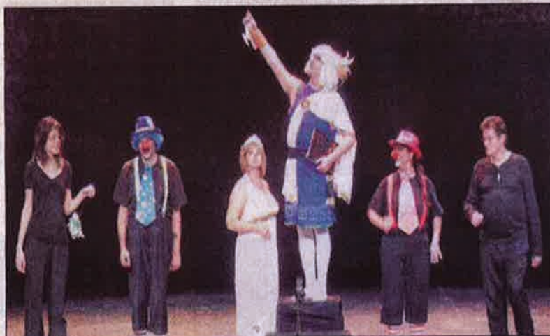
Instants de complicité scénique entre comédiens valides et personnes en situation de handicap!