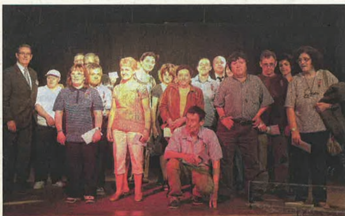
Des médailles ont été remises à 66 travailleurs handicapés des différents établissements et services d'aide par le travail.

L'Association des amis et parents d'enfants inadaptés des Alpes-Maritimes (Adapei - A.M.) dispose aujourd'hui de 1800 places réparties dans 46 établissements et services, pour l'accueil des personnes atteintes de déficience intellectuelle. Ces lieux d'accueil gérés par l'association, ce sont : 1 Institut médico-éducatif (IME) de 124 places, dont 12 en internat ; 5 Établissements et services d'aide par le travail (Esat) représentant 901 postes de travail ; 5 sections d'accompagnement spécialisé rattachées aux Esat (72 places) ; 7 foyers d'hébergement accueillant 220 résidents + 1 place d'accueil temporaire ; 6 foyers éclatés d'une capacité de 102 lits ; 6 foyers de vie (158 lits + 2 places