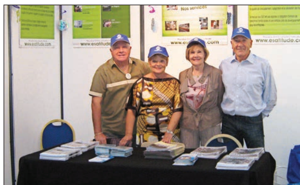
Le stand de la Section de Nice de l'ADAPEI-AM

A l'occasion de leur visite ont été évoquées les difficultés que rencontre l'ADAPEI-AM pour satisfaire les demandes de placements pour les personnes handicapées, par manque de structures.