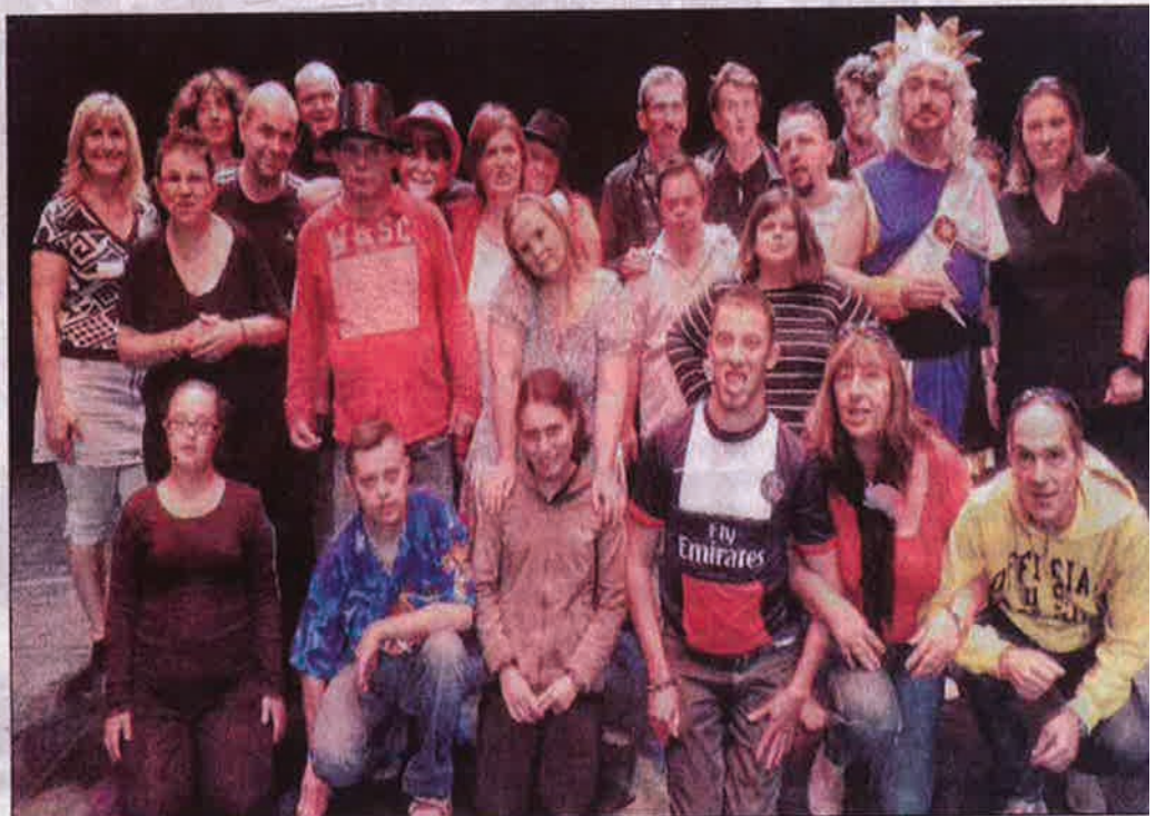
Art et handicap, ou le bonheur de s'épanouir en toute confiance!