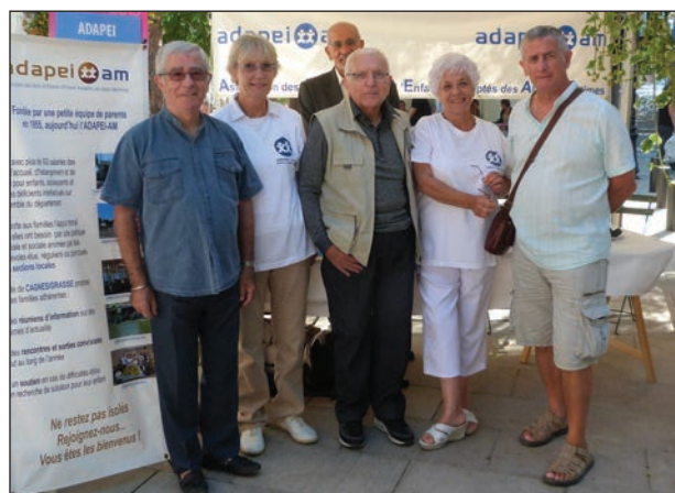
Le stand de la Section de Cagnes/Grasse de l'ADAPEI-AM

La rencontre avec la population, les échanges avec les Elus Municipaux et la visite amicale de nombreuses familles adhérentes... ont été, pour les membres du Bureau de la Section, le menu de ce samedi ensoleillé !